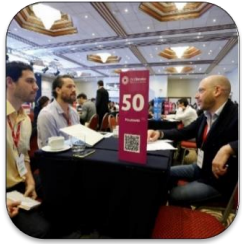
Rueda de Negocios

El evento busca generar diversas oportunidades entre las empresas de servicios peruanas, por ello se ha organizado diferentes actividades que faciliten además, el intercambio de conocimientos y sinergias entre otras empresas del sector